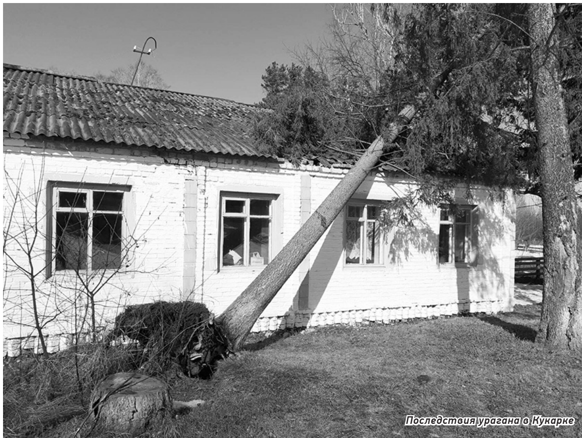
Последствия урагана в Кукарке

Пострадали от бури и другие населенные пункты муниципалитета. Так, денисовцы на некоторое время остались без света из-за обрыва проводов. В Кукарке с жилого дома сорвало кровлю на площади 80 квадратных метров, замкнули электрические провода и пока электрики в течение получаса устраняли аварию, село было обесточено. Две мощных сосны ветер уложил на землю. От бури в Унаре